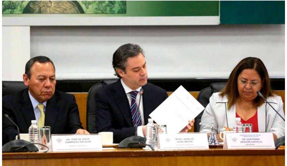
Jesús Zambrano, presidente de la Mesa directiva de la Cámara de Diputados; Aurelio Nuño, secretario de Educación Pública, y Hortensia Aragón, presidenta de la Comisión de Educación Pública y Servicios Educativos de la Cámara de Diputados.

* Con información de SEP, Reforma, Proceso y La Jornada